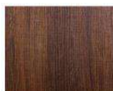
CPL 55 M